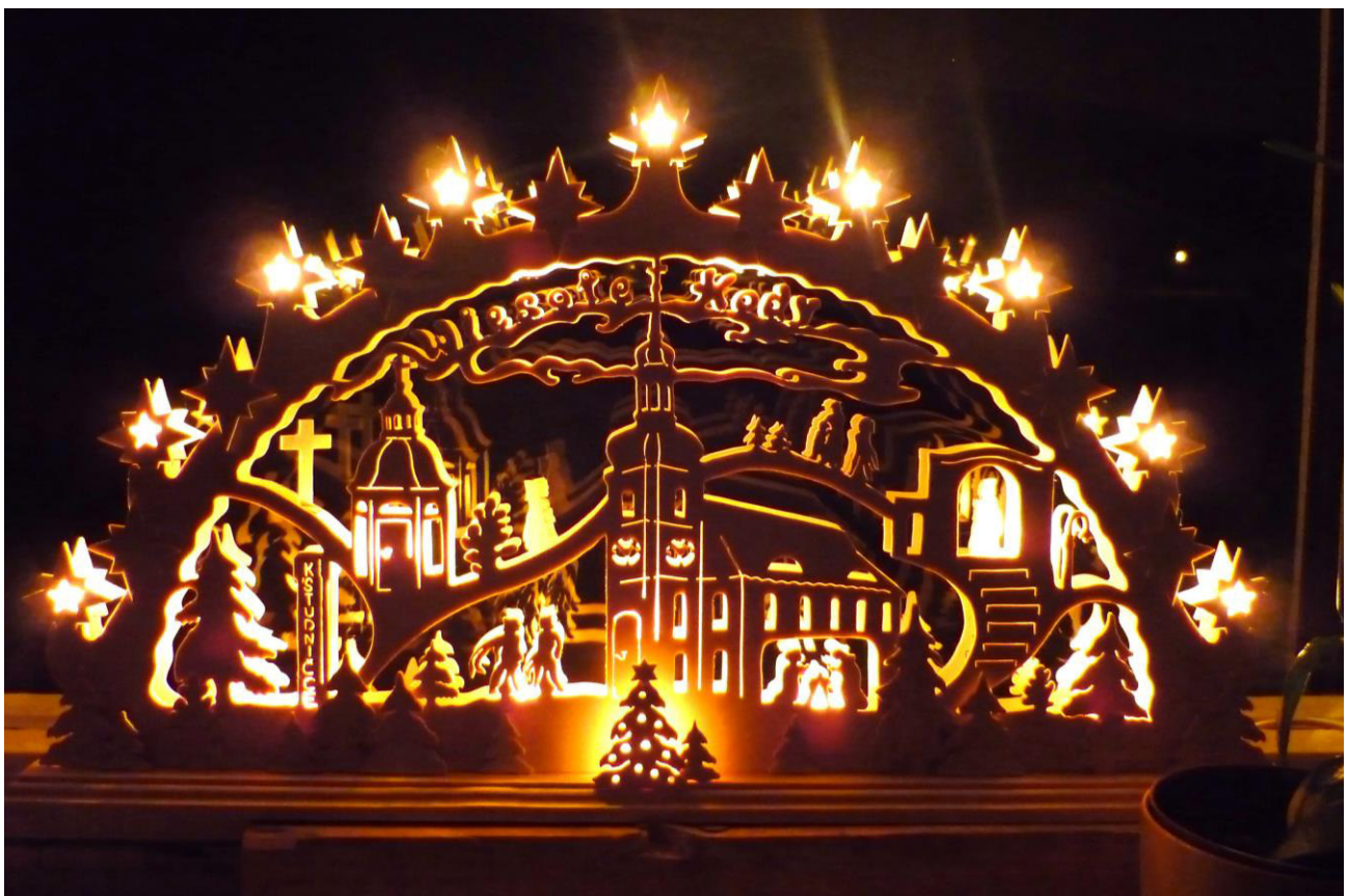
Swěčkaty wobłuk z Róžeńčanskej swjatnicy jako motiw

31. lětnik / 7. wudaće Hamske łopjeno wulki rózki 2021 22.12.2020 www.ralbitz-rosenthal.de gemeinde@ralbitz-rosenthal.de