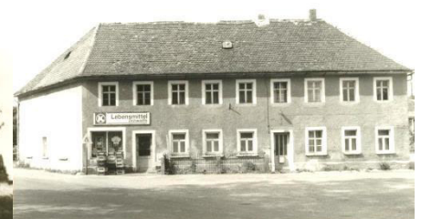
Bywši konsum w Ralbicach – nětko městno Jahnyjec lěkarskeje praksy

Jedna z „najwjetšich“ investicijow bě ponowjenje sportoweje halez nowotwarom zakładneje šule a saněrowanjom twarjenja wyšeje šule. Tež zelenišća při šuli a sportowej hali buchu twarjene a wuhotowane. Hladajo na twarjenja bu tež hišće sportowy dom ponowjeny.