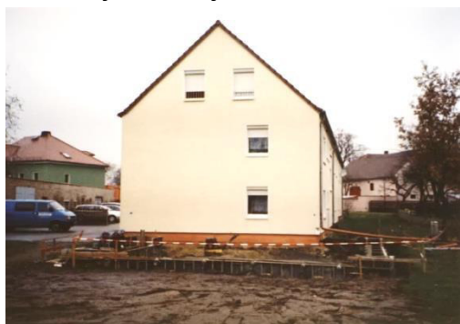
Přitwar na pěstowarnju

W Ralbicach, runje tak kaž w Konjecach a Šunowje, přewjedže so přez zjednoćenstwo wobdźělnikow noworjadowanja kraja, hdžež so ležownosće znowa rjaduja (TG). Přez tute noworjadowanje so w tutych třoch wsach naprawy planuja a přewjeduja, štož so wotpowědne woznamjenja. Noworjadowanje kraja běži přez wokrjes a so přez přinoški wobsedźerjow ležownosćow sobu financuje. Wotmysł noworjadowanja ležownosćow je přewjedženje wuměrjenja kraja a noworjadowanje ležownosćow we wobłuku tutych třoch wsow.