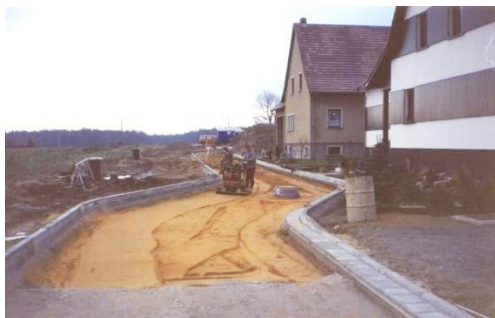
Wutwar Dróhi Mikławša Andrickeho