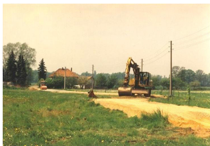
Wutwar Młynskeho puća