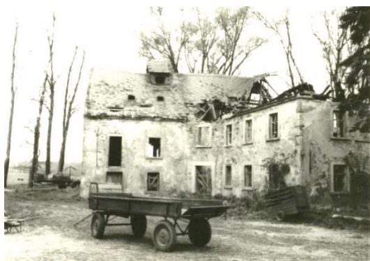
Jurasowy młyn w Nowoslicach

Tež w Nowoslicach je so w zaštych lětdžesatkach wjele hibało. Tak bu Kulturny dom z młodžinskim klubom z džělowej pomocu wobydlerjow twarjeny a gmejna kupi ležownosće, na kotrychž so sportnišćo z hrajkanišćom zarjadowaše. Wutwarjenej buštej Młynski puć a Lipowy puć. Tež nawjes so znowa wuhotowaše a wutwari.