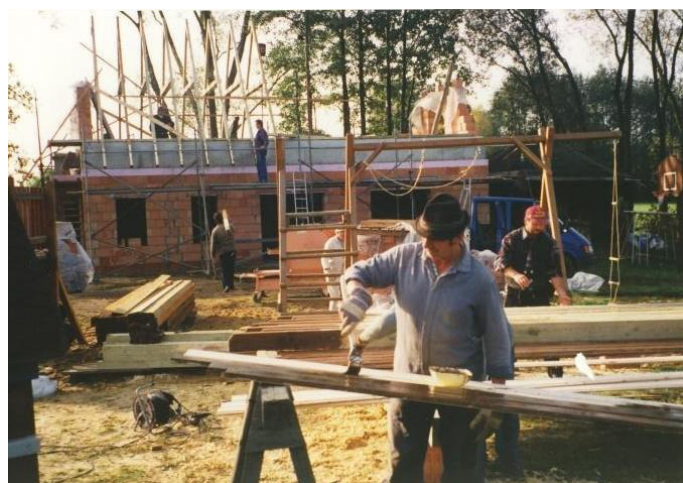
Wobydlerjo twarja Kulturny dom.