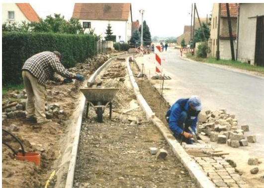
Twar chódnika na Hłownej dróże