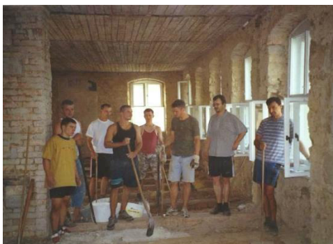
Wobornicy při dźělach w starej šuli