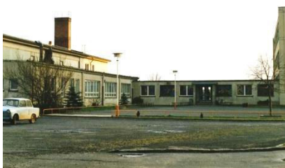
Šula před saněrowanjom

Byrnež so poprawny napohlad wsy bytostnje změnił njeje, je so tola tójšto realizowało. Tak bu parkowanišćo napřećo cyrkwi twarjene, Šulski puć a Dróha Mikławša Andrickeho buštej z nowym nadróžnym wobswětlenjom wuhotowanej a docyła z wotwódnjenjom wutwarjenej. Tež nawjes z wjesnym hatom bu ponowjena a dósta wotwódnjenje a nowe wobswětlenje (TG). Nimo toho bu Stara šula ponowjena a při njej nowa gratownja wohnjoweje wobory natwarjena. Při tym je so wjele twarskich dźěłow w nowej a starej šuli wot kameradow dobrowólnych wohnjowych woborow a wot towarstwow wukonjało. Přez bywšeho nošerja, Křesćansko-socialneho kubłanskeho skutka (CSB) Miłočicy, bu dnjowe přebywanišćo saněrowane a po změnje nošerja na Serbske šulske towarstwo z. t. wot gmejny z pomocu přitwarka powjetšene.