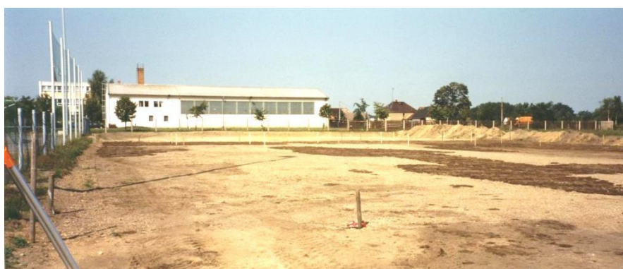
Nowotwar sportnišća za šulu