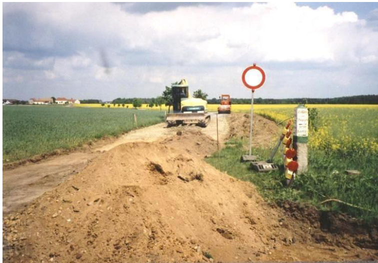
Wutwar statnjeje dróhi S 101 do směra Dobrošic

Gmejna staraše so nimo toho wo twar chódnika, nadróžne wobswětlenje a wotwódnjenje statnjeje dróhi S 101. Zakładny wutwar statnjeje dróhi S 101 přez wjes přewza Swobodny kraj Sakska.