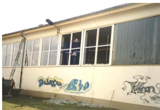
Stara sportowa hala