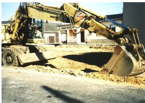
Saněrowanja měštna před stadionom