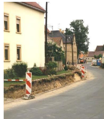
Wutwar Hłowneje dróhi

Tež na polu dróhotwara je so tójšto hibało: Tak bu wokrjesna dróha K 9225 přez wjes wot Budyskeho wokrjesa wutwarjena. Nimo toho buchu chódniki a nowe nadróžne wobswětlenje twarjene. Wokrjesnu dróhu K 9225 mjez Ralbicami a Nowoslicami je wokrjes dospołnje ponowił.