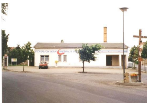
Parkowanišće lěkarskeje praksy a cyrkwe

Tež na polu dróhotwara je so tójšto hibało: Tak bu wokrjesna dróha K 9225 přez wjes wot Budyskeho wokrjesa wutwarjena. Nimo toho buchu chódniki a nowe nadróžne wobswětlenje twarjene. Wokrjesnu dróhu K 9225 mjez Ralbicami a Nowoslicami je wokrjes dospołnje ponowił.