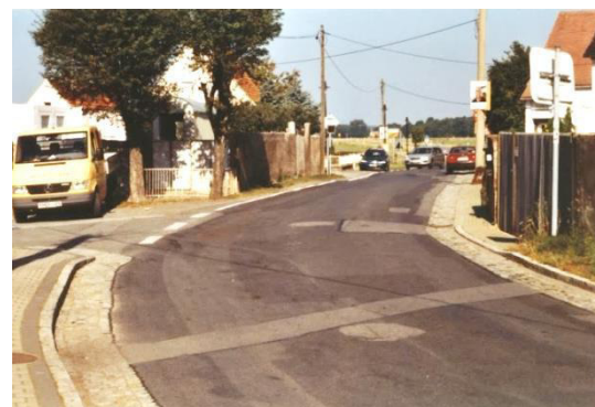
Saněrowanje Hłowneje dróhi