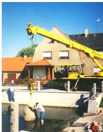
Twar Wódneho muža při wjesnym haće