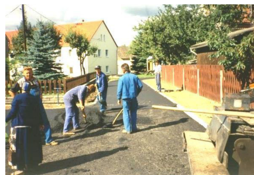
Wutwar na nawsy