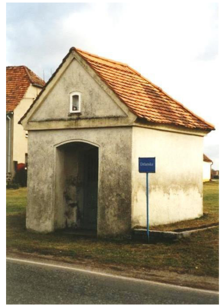
Kapačka před sarněrowanjom

Gmejna staraše so nimo toho wo twar chódnika, nadróžne wobswětlenje a wotwódnjenje statnjeje dróhi S 101. Zakładny wutwar statnjeje dróhi S 101 přez wjes přewza Swobodny kraj Sakska.