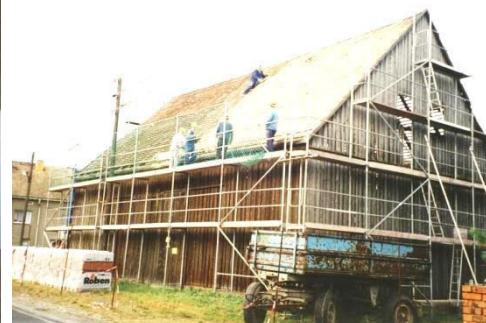
Saněrowanje komunalneje bróžnje

W Ralbicach, runje tak kaž w Konjecach a Šunowje, přewjedže so přez zjednoćenstwo wobdźělnikow noworjadowanja kraja, hdžež so ležownosće znowa rjaduja (TG). Přez tute noworjadowanje so w tutych třoch wsach naprawy planuja a přewjeduja, štož so wotpowědne woznamjenja. Noworjadowanje kraja běži přez wokrjes a so přez přinoški wobsedźerjow ležownosćow sobu financuje. Wotmysł noworjadowanja ležownosćow je přewjedženje wuměrjenja kraja a noworjadowanje ležownosćow we wobłuku tutych třoch wsow.